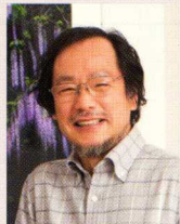
写真家 鈴木 一雄

1953年福島県生まれ。法政大学法学部卒。民間企業、地方公務員を経て自然写真家になる。フォト寺子屋「一の会」主宰。写真集に「サクラニキル」「花乃聲」「季乃聲」「櫻乃聲」「おぐにの聲」「裏磐梯の聲」「尾瀬の聲」他、著書に「日本の桜200選」「デジタル露出の極意」など多数。しあわせな写真人生のための「自慢史つづりと自分史つづり」を提唱。新潟県展を含め、県展や写真雑誌など各種フォトコンテスト審査員を数多く務める。